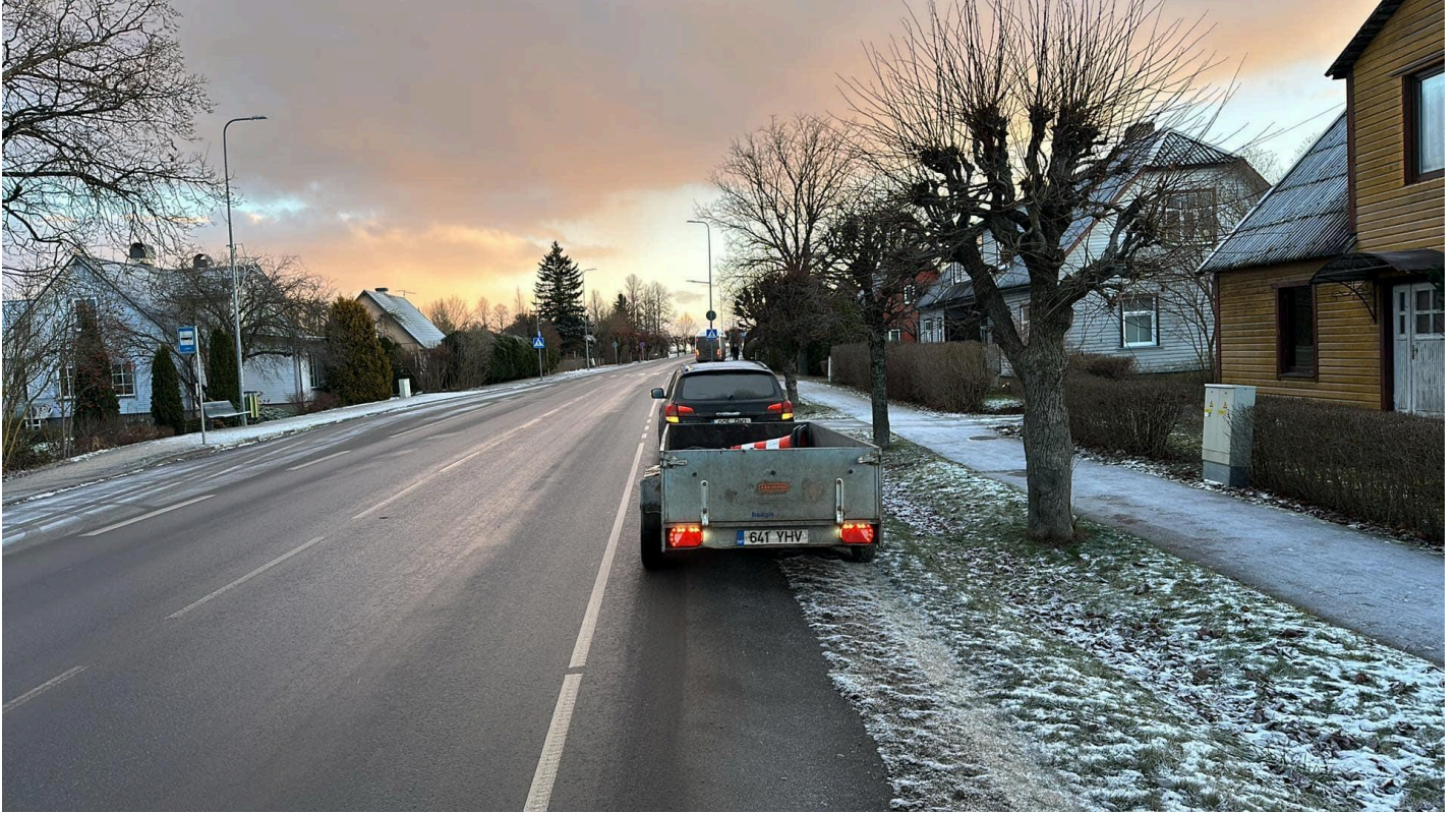
Lisa 1. Sõiduauto koos järelhaagisega teepeenral